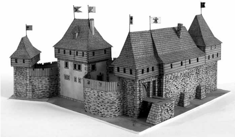
MODEL HRADU SION VYŠEL V ČASOPISE ABC. V TOMTO PERIODIKU BYLY PUBLIKOVÁNY TAKÉ HRADY LITICE, ŠVIHOV NEBO ZÁMEK V ROZTOKÁCH.