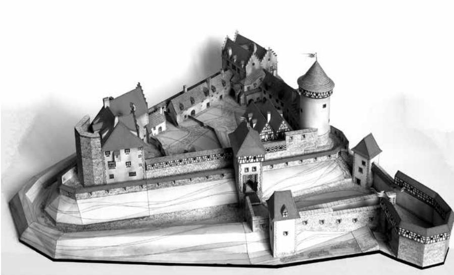
MODEL HRADU LICHNICE. O JEHO VZNIKU BYL V ROCE 2012 NATOČEN POŘAD ČESKÉ TELEVIZE HLEDAČI ČASU: PAPIŘOVÝ HRAD.