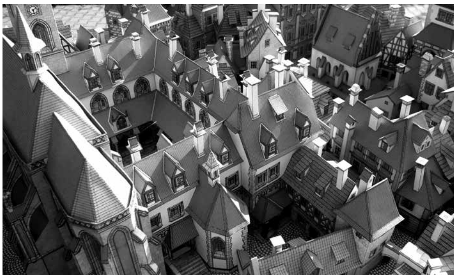
DETAIL JEDNÉ Z ČÁSTÍ MODELU MĚSTSKÉ PAMÁTKOVÉ REZERVACE, KTERÝ JE OZNAČOVÁN ZA NEJVĚŠÍ PAPIŘOVÝ MODEL SOUČASNOSTI.